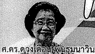
ศ.ดร.ดวงเดือน พันธุมนาวิน