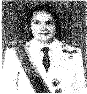
๑. นางยุพิน ชลานนพินวัฒน์ รองผู้ว่าการตรวจเงินแผ่นดิน (ด้านการตรวจเงินแผ่นดิน)

หากท่านผู้ใดมีข้อมูล ข้อเท็จจริง และข้อคิดเห็นเกี่ยวกับผู้ได้รับการเสนอชื่อ ให้ดำรงตำแหน่งกรรมการตรวจเงินแผ่นดิน :