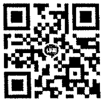
แผนที่ อาคารหอประชุมพ่อขุนรามคำแหงมหาราช มหาวิทยาลัยรามคำแหง หัวหมาก