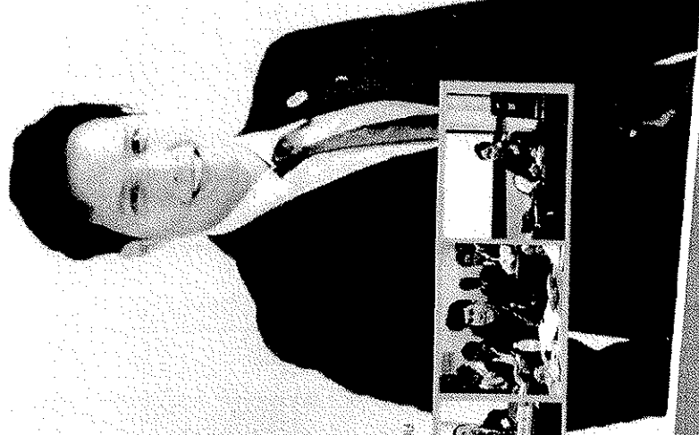
วันพฤหัสบดีที่ 8 กุมภาพันธ์ 2561 ณ อาคารเฉลิมพระเกียรติ 80 พรรษา 5 ธันวาคม 2550 มหาวิทยาลัยราชภัฏศรีสะเกษ