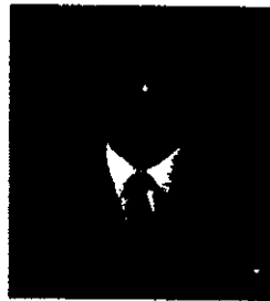
๑๓. นายประเสริฐ กิตยาธิคุณ ประธานกรรมการบริหารมูลนิธิสั่นหมื่น เพื่อการศึกษา - พิชณโลก และประธานกรรมการอำนวยการบริหาร โรงเรียนสั่นหมื่น