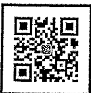
Line สอบถามข้อมูล