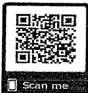
สมัครออนไลน์